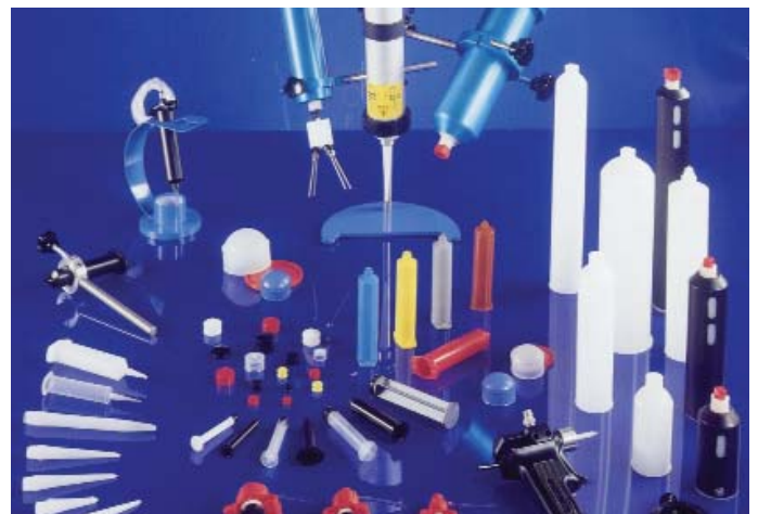
Ergänzend dazu halten wir das passende Zubehör bereit.

Mehr Informationen zu den einzelnen Produktgruppen entnehmen Sie bitte den speziellen Produkt-Datenblättern. Zum umfangreichen Zubehörprogramm für die jeweiligen Gerätesortimente fordern Sie bitte unsere Detailinformationen an.