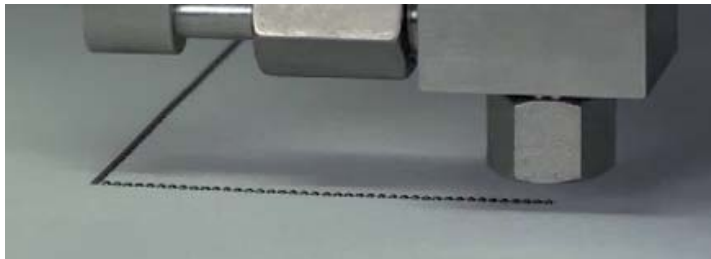
Liquidyn Jet Dispenser