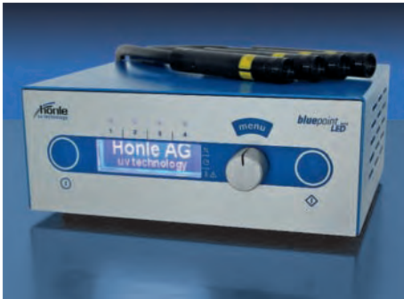
bluepoint LED eco

Der Punktstrahler bluepoint LED eco wurde für Anwendungen entwickelt, die eine hochintensive UV-Bestrahlung benötigen. Durch die hohe Intensität und die Möglichkeit der Programmierung kompletter Programmabläufe, wie beispielsweise Belichtungsfolgen mit