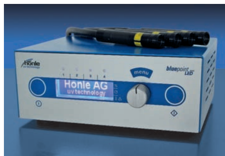
bluepoint LED eco

Durch die hohe Intensität und die Möglichkeit der Programmierung kompletter Programmabläufe, wie beispielsweise Belichtungsfolgen mit unterschiedlichen Intensitäten und