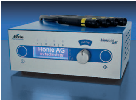
bluepoint LED eco

Der Punktstrahler bluepoint LED eco wurde für Anwendungen entwickelt, die eine hochintensive UV-Bestrahlung benötigen. Durch die hohe Intensität und die Möglichkeit der Programmierung kompletter Programmabläufe, wie beispielsweise Belichtungsfolgen mit